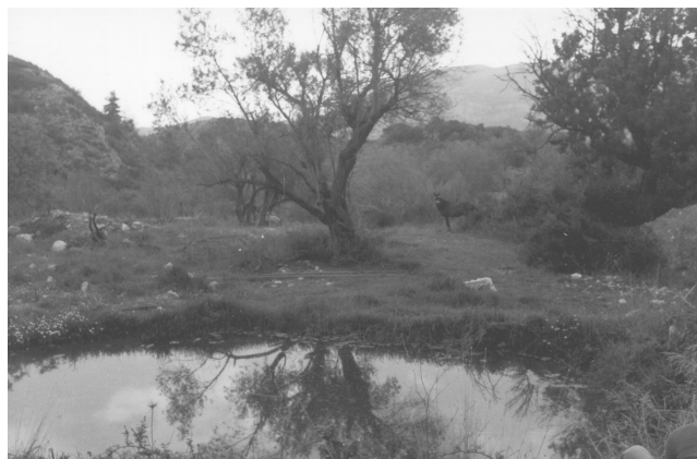
...Παφυλίδα και ο όλος εύθετος τόπος...