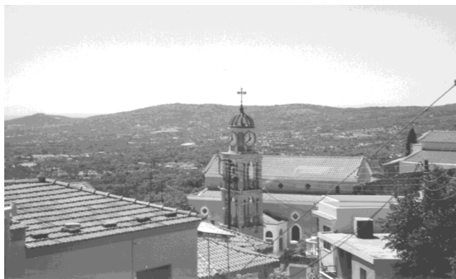
...Τ άλλα καμποχώρια... τον Κάμπο ...κι απέναντι...