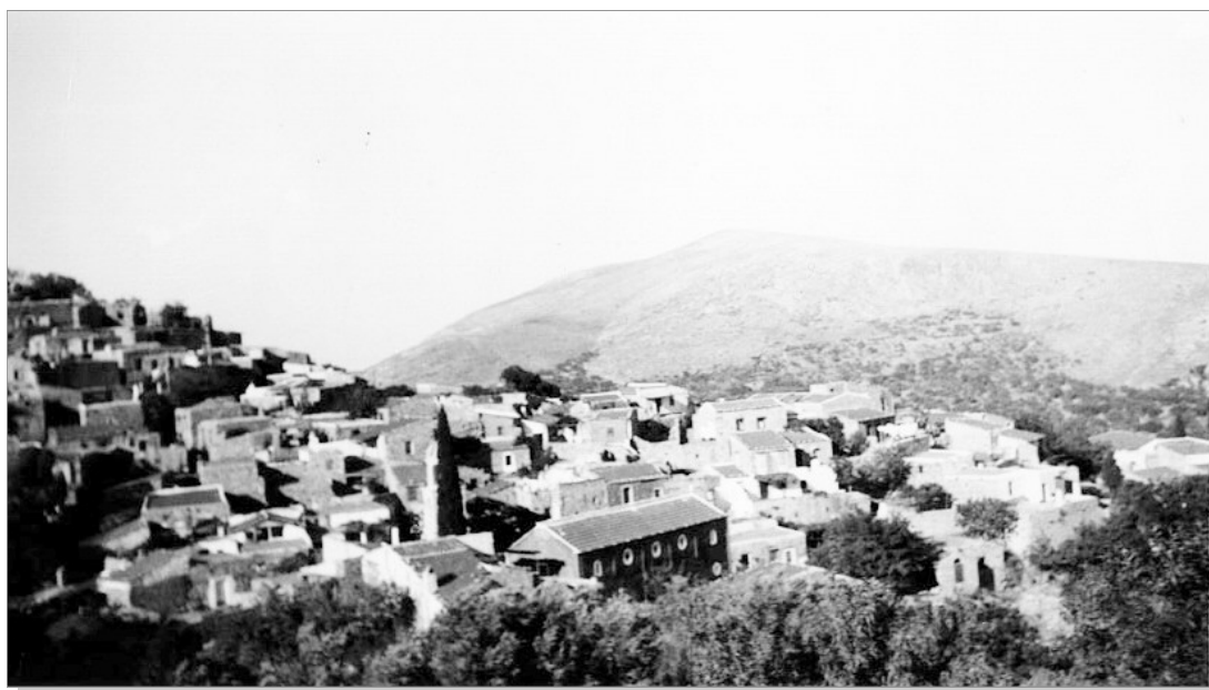
Ο Δαφνώνας το 1949

Από το πρώτο φύλλο του περιοδικού «Δάφνη», Απρίλης 1999