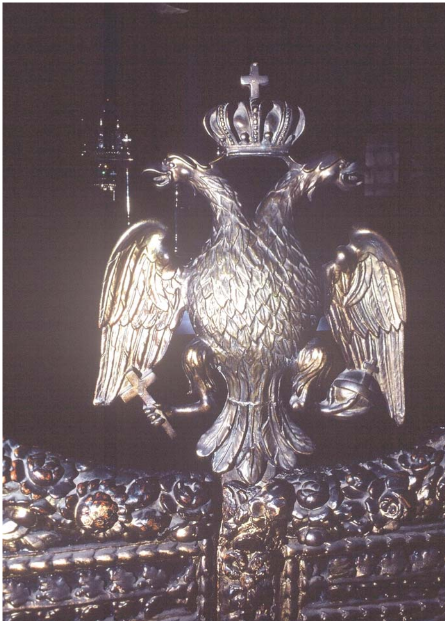
Από το Οικουμενικό Πατριαρχείο Κωνσταντινουπόλεως

Σ' αυτόν εδώ τον Άγιο Τόπο θαυματουργούν τα