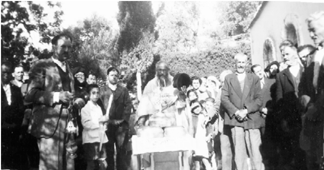
Αρτοκλασία στην αυλή του Αγίου Γεωργίου Β. Α. του χωριού

Εκτός του καθεδρικού ναού, υπάρχουν και τα κάτωθι εξωκλήσια, των οποίων ο χρόνος της ιδρύσεώς των τυγχάνει άγνωστος: