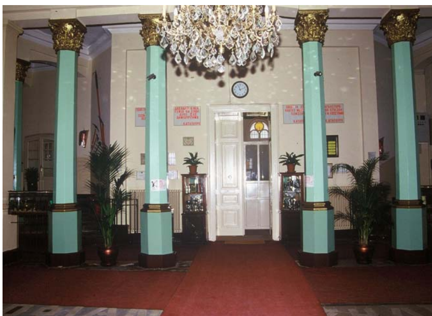
Από το εσωτερικό της Μεγάλης του Γένους Σχολής