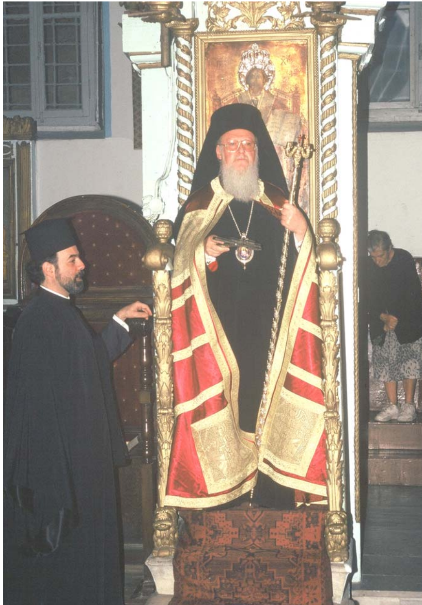
Η Α. Θ. Π. ο Οικουμενικός Πατριάρχης κ. κ. Βαρθολομαίος

Στην Βασιλεύουσα ο εκάστοτε Οικουμενικός Πατριάρχης είναι ο θεματοφύλακας της Ορθοδοξίας, μετά δε την άλωση της Πόλης και ο Εθνάρχης του Γένους. Η εκλογή του είναι θέλημα Θεού και το χέρι Του Πανάγαθου τον ορίζει για να επωμισθεί τις ευθύνες της Ρωμοσύνης και να φέρει σε πέρας ένα μεγάλο έργο κάτω από ιδιαίτερα δύσκολες συνθήκες, με αβέβαιο μέλλον. Παρ' όλη την πίεση που δέχεται καθημερινά, συναντά και την αχαριστία ορισμένων που αν και ευεργετήθηκαν από Αυτόν, Τον ποτίζουν το πικρόν ποτήριον της αχαριστίας.