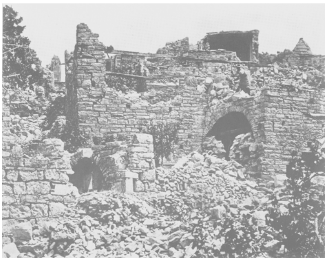
Από τα ερείπια του σεισμού στον Δαφνώνα.

Η μοναδική ασχολία των κατοίκων είναι η γεωργία από παλαιάς εποχής μέχρι της σήμερον και η δενδροκομία ήτις ευδοκimei λόγω της ποιότητος του εδάφους. Μερικοί εκ των κατοίκων ανεχώρησαν προ της απελευθερώσεως και μετά, εις την Αμερικήν, Πειραιά και αλλαχού δι' ανεύρεσιν εργασίας ή καλλιτέρας τύχης, όπου εγκατεστάθησαν, δημιουργήσαντες οικογενείας, αποζώντες εκ διαφορών επαγγελμάτων.