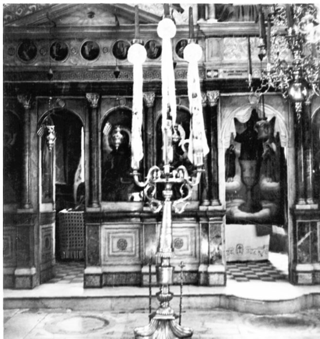
Το εσωτερικό της Νέας Μονής πριν το 1940

Ο αντιπρόσωπος του Μητροπολίτου Παντελεήμων