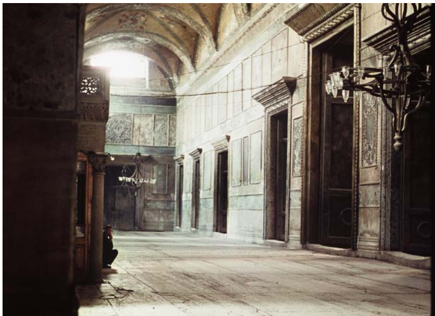
Ο Νάρθηκας του Ναού της Του Θεού Σοφίας