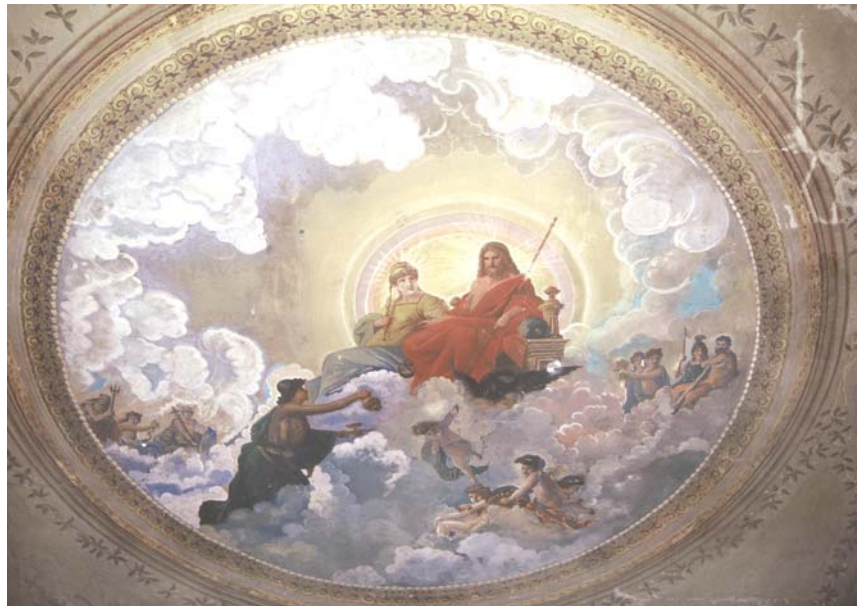
Ολύμπιοι Θεοί από το Ζάππειο Παρθενάγωγείο της Πόλης