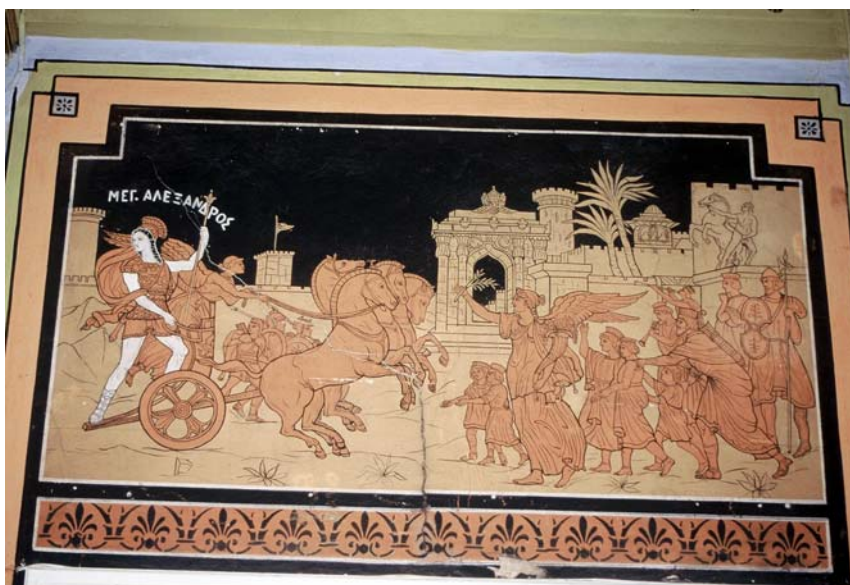
Υπέρθυρο στη Μεγάλη του Γένους Σχολή