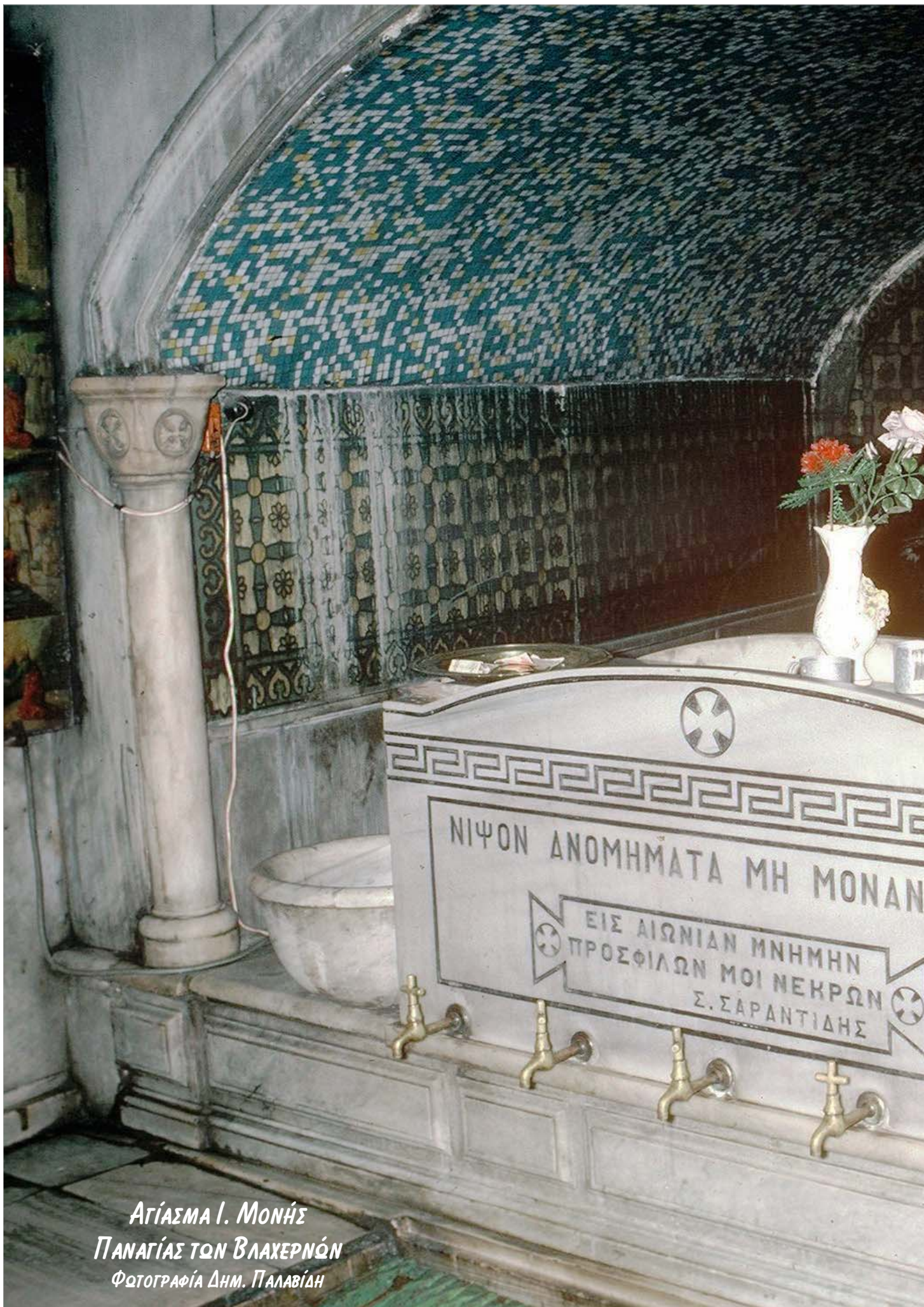
ΑΓΙΑΣΜΑ Ι. ΜΟΝΗΣ ΠΑΝΑΓΙΑΣ ΤΩΝ ΒΛΑΧΕΡΝΩΝ