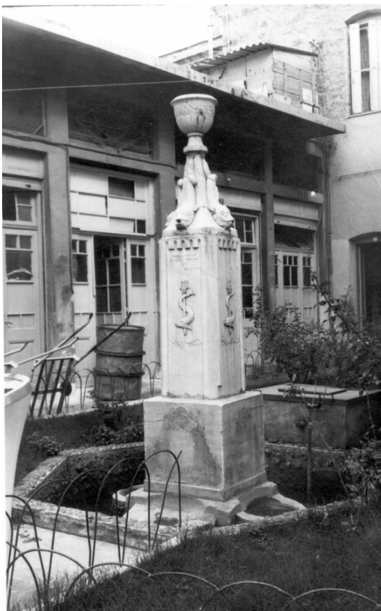
Η βρύση του Συγγρού Στη Χίο

Είτα δε λαβών τον λόγον ο σχολάρχης κ. Πρώιος, εξεφώνησε λογύδριον, μεθ' ο ότε δεξιός και αριστερός χορός της Μητροπόλεως έψαλλαν εμμελέστατον ύμνον υπερ της Α. Α. Μ. Του Σουλτάνου. Ακολούθως δ' ανοιχθέντων απάντων των περί την περί την περικαλλή της κρήνης στήλην κρουών και των επ' αυτής πιδάκων, τα ύδατα ήρξαντο ρέοντα, οι δε κάτοικοι την αφθονίαν ταύτην βλέποντες ηυλόγουν εν αγαλιάσει το όνομα του δωρητού».