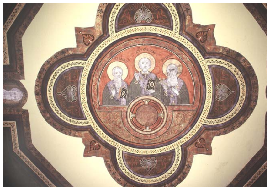
Οι τρεις Ιεράρχες από τη Μεγάλη του Γένους Σχολή της Πόλης