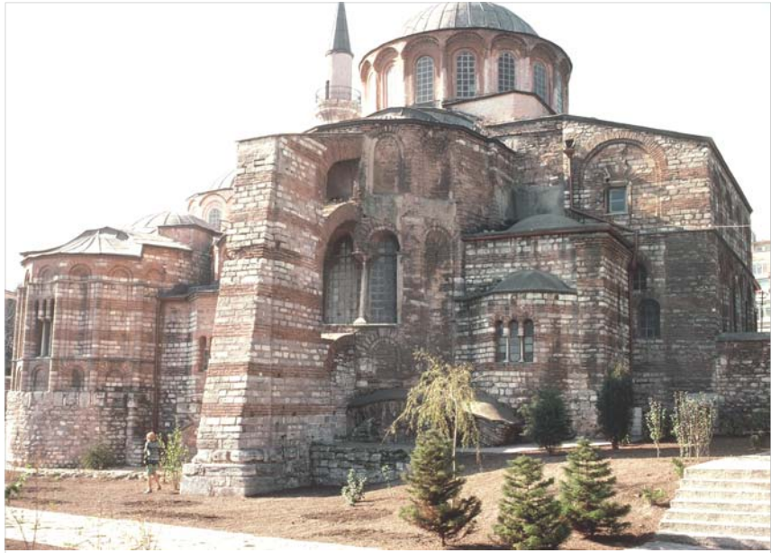
Κωνσταντινούπολη Μονή Χώρας