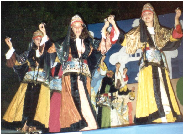
Ένα από τα χορευτικά μας

Μετά λοιπόν από συνεννόηση, προχωρήσαμε στην ίδρυση νέου, ανεξάρτητου μη κερδοσκοπικού φορέα, με την επωνυμία «Πολιτιστικός Επιμορφωτικός Εκδοτικός Οργανισμός Δαφνώνα Χίου» με τον διακριτικό τίτλο «Περιοδικό Δάφνη».