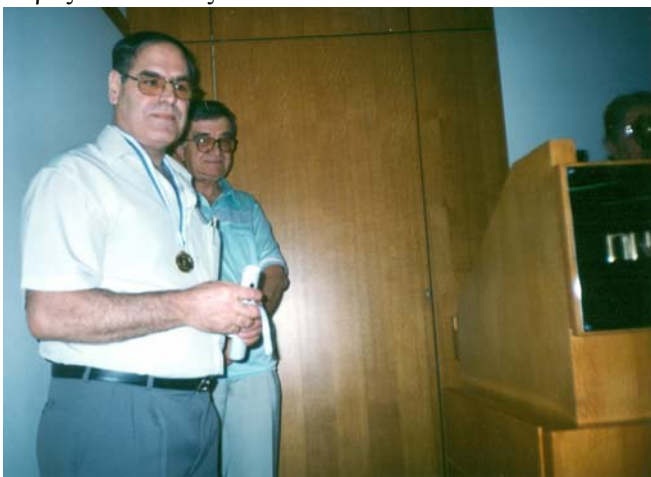
Από την απονομή των διπλωμάτων και μεταλλίων στο Ομήρειο

Την πρώτη μέρα η έναρξη, οι ομιλίες, οι χαιρετισμοί και στη συνέχεια συναυλία, από την ορχήστρα του Δήμου Χίου με διεύθυνση Στέργιου Νεαμονιτάκη. Η συναυλία κατέληξε σε χορό μέχρι τις πρωινές ώρες. Ακολούθησαν οι κατασκευαστικές ακολουθίες (εσπερινός και θεία λειτουργία) του Αγίου Παντελεήμονα 26 και 27 Ιουλίου αντίστοιχα και τα βράδια στις 27 και 28 το διήμερο πανηγύρι του χωριού που κάθε χρόνο συγκεντρώνει πάνω από χίλια άτομα. Στη συνέχεια εκδρομή (30 του μήνα) σε Χιώτικες παραλίες και στις 31 παιδική βραδιά με αθλοπαιδιές, παιδικό θέατρο «Ειρήνη» του Αριστοφάνη, παιδικό σκετς και κατόπιν τα χορευτικά των Συλλόγων μας χόρεψαν παραδοσιακούς χορούς που εντυπωσίασαν. Την Τετάρτη 2 Αυγούστου θέατρο με ερασιτέχνες Δαφνούσους ηθοποιούς στο έργο του Δημήτρη Ψαθά «Φωνάζει ο κλέφτης», που άφησε στους παρευρισκομένους τις καλύτερες εντυπώσεις.