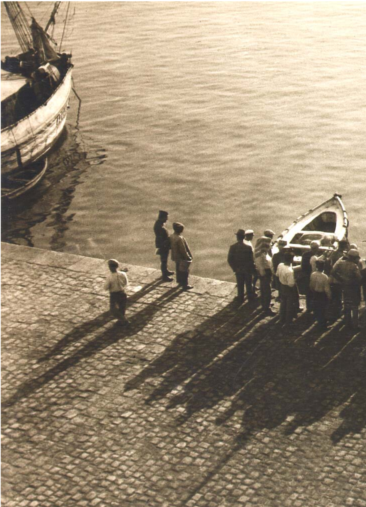
Πρωινό στο λιμάνι της Χίου μιας άρλης εποχής, γαράδες, ξεφορτώνουν γάρια.