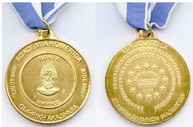
Ένα από τα τέσσερα μετάλλια της Ομηρικής Ακαδημίας που πήρε ο Δαφνώνας