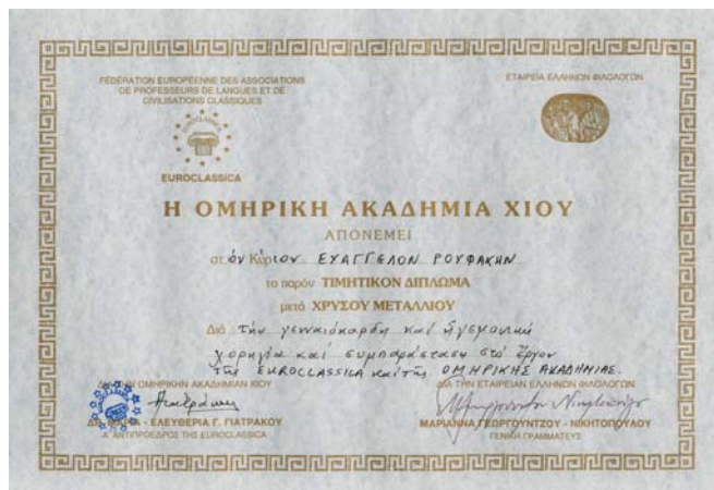
Ένα από τα 4 τιμητικά διπλώματα της Ομηρικής Ακαδημίας που ήλθαν στο χωριό μας

Περιοδικό «Δάφνη» που μόλις είχε κυκλοφορήσει κι ένα αντίτυπο του ιστορικού άρθρου «Δαφνώνας», από το πρώτο φύλλο του περιοδικού μας. Έτσι τ' όνομα και η συνοπτική ιστορία του χωριού μας, ταξίδεψαν σε 17 χώρες του κόσμου.