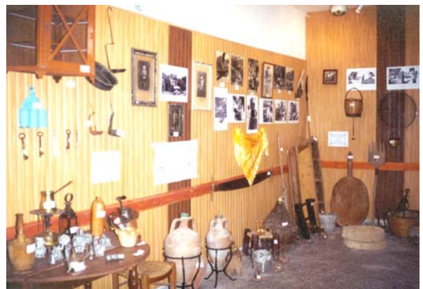
Παλιά αντικείμενα και φωτογραφίες

Μόλις τακτοποιήσαμε τα νομικά, αρχίσαμε την οργάνωση της πρώτης μας εκδήλωσης στην πόλη της Χίου, στις 27 Οκτωβρίου. Αφού συμφωνήσαμε με την Δρ Μαρία-Ελευθερία Γιατράκου για την ημέρα και το θέμα της ομιλίας (Ανταύγειες από την 28η Οκτωβρίου 1940), «κλείσαμε» την αίθουσα παραστάσεων του Ομηρείου Πνευματικού Κέντρου Δήμου Χίου και αρχίσαμε δουλειά. Ζητήσαμε την συνεργασία και συμπαράσταση του Δήμου Καμποχώρων την οποία εξασφαλίσαμε και μαζί, είχαμε μια ακόμα επιτυχία. Χαλάλι οι κόποι μας. Πληρωθήκαμε με το παραπάνω. Η ομιλήτρια με τον δικό της μοναδικό τρόπο κατάφερε να συγκινήσει το ακροατήριο, αφού κι εκείνη πρώτη έτρεμε από συγκίνηση. «...Τώρα, χτυπάει πιο γρήγορα το όνειρο μες το αίμα. Του κόσμου η πιο σωστή στιγμή σημαίνει. Ελευθερία...»