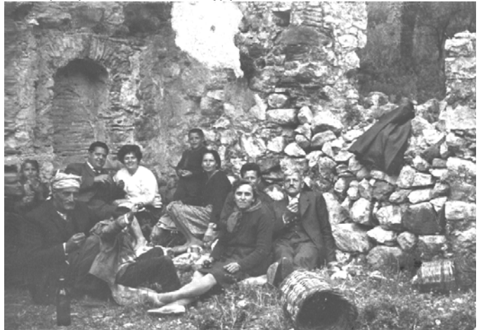
Στου Χαλλιορή δεκαετία του '60

Το χωρίον διετήρησε σχεδόν τον αρχικόν του τύπον της ανεγέρσεως μετά τον σεισμόν του 1881, επεκταθέν ολίγον προς την Ν. Α. περίπου άκρην αυτού, μετά την μετοίκησιν των κατοίκων εκ της θέσεως Λαυρίνας κατά την προ του 1821 εποχήν.