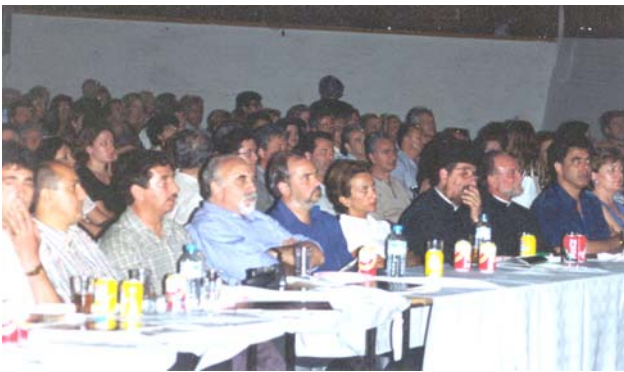
Από την έναρξη των εκδηλώσεων «Δαφνώνας 2000»

Σ' όλη την διάρκεια των εκδηλώσεων, πουλήθηκαν διάφορα αναμνηστικά, με το σήμα «Δαφνώνας 2000». Από τα κέρδη τους, τα κέρδη από το λαχείο, από την πώληση φαγητών και ποτών, πολύ περισσότερο από τα πανηγύρια, καθώς και από την οικονομική βοήθεια του Δήμου Καμποχώρων, των τριών Συλλόγων και δωρεών, συγκεντρώθηκε ένα μεγάλο χρηματικό ποσό. Οι Γενικές Συνελεύσεις των τριών Συλλόγων που συνεργάστηκαν στις εκδηλώσεις, θα κάνουν εισηγήσεις και αργότερα θα ψηφίσουν πού να διατεθούν τα χρήματα αυτά. Μια ιδέα που σιγοψιθυρίζεται στο χωριό, είναι η αγορά κτηρίου ή οικοπέδου για την ίδρυση Πνευματικού Κέντρου Δαφνώνα. Το ευχόμαστε ολόψυχα.