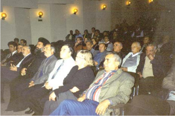
Επίσημοι και απλοί πολίτες γέμισαν το Ομηρείο

Μετά από την κυκλοφορία του φύλλου που κρατάτε στα χέρια σας (Δεκέμβριο 2000) και την επιστροφή από την Αθήνα όπου θα συνεργαστούμε με πρόσωπα και φορείς, θα προχωρήσουμε στην έκδοση βιβλίων γνωστών ποιητών και συγγραφέων της Χίου.