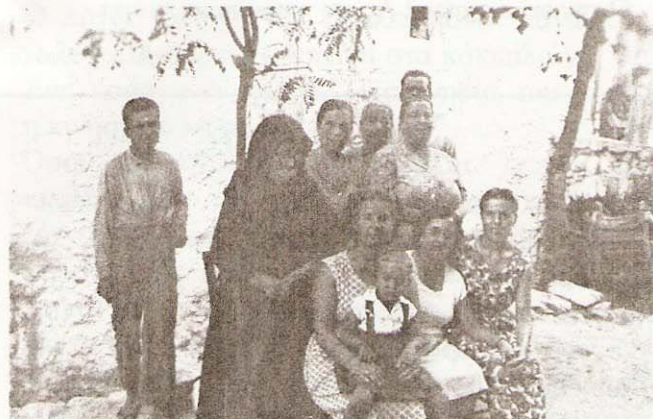
Καλοκαίρι στην όχθη του ποταμού. Στο βάθος, ένα γεφυράκι.

Ήτανε Δεκέμβρης, 1958 ή 1959, δεν θυμούμαι. Χειμώνας βαρύς. Ο ποταμός που σήμερα περνά κάτω απ' τον κεντρικό δρόμο του χωριού ήταν ακόμη ξεσκεπάστος κι όταν κυλούσε ήρεμος κάτω απ' τα γραφικά του γεφυράκια χαιρόσουν να τον βλέπεις. Μα 'κείνη τη χρονιά που χαλούσε ο κόσμος απ' τη βροχή κάθε τόσο, ο ποταμός μούγκριζε μέρα νύκτα κατεβάζοντας κλαδιά και βράχους και μερικές φορές στο πιο ρηχό σημείο, ξεχειλούσε.