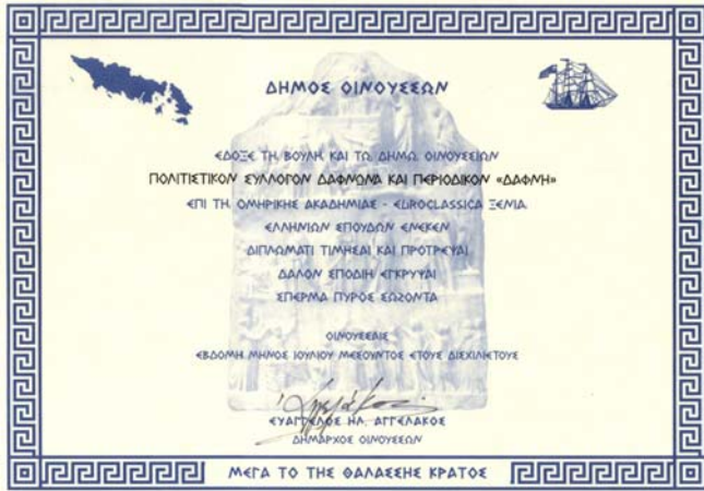
Το τιμητικό δίπλωμα του Δήμου Οινουσσών

Το επόμενο βήμα προς την επιτυχία έγινε με τις εκδηλώσεις «Δαφνώνας 2000» Από τις 24 Ιουλίου και μέχρι τις 6 Αυγούστου ο Δαφνώνας έζησε σε έναν άλλο ρυθμό. Από ένα χρόνο και περισσότερο η δωδεκαμελής Οργανωτική Επιτροπή που είχε οριστεί από τον Πολιτιστικό Σύλλογο Δαφνώνα, Αδελφότητα Δαφνουσίων Αττικής και Σύλλογο Δαφνουσίων Αμερικής, σε συνεργασία με όλους τους χωριανούς ιδιαίτερα τους νέους, δουλέψαμε σκληρά αλλά το αποτέλεσμα μας δικαιώσε.