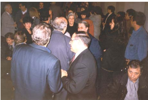
Ο κόσμος φεύγει ευχαριστημένος

Η προσπάθειά μας είναι ανιδιοτελής, αλλά ο προϋπολογισμός μας μεγάλος που είναι αδύνατο να καλυφθεί από ίδια έξοδα. Χρειαζόμαστε βοήθεια από κάθε ιδιώτη ή φορέα που έχει τα ίδια ενδιαφέροντα