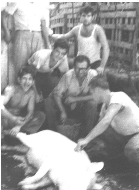
Το σφάξιμο του χοίρου

Τρεις μέρες πριν τα Χριστούγεννα, σταμάτησε η βροχή. Οι γυναίκες νοικοκύρεψαν τα σπίτια, οι άντρες πήγαν στο βουνό και μάζεψαν ξύλα για το φούρνο κι έψησαν οι γυναίκες τα γλυκά κι εμείς τα παιδιά χωρίς να φοβηθούμε το ξεροβόρι που πήρε μετά τη βροχή, είπαμε τα κάλαντα και τον Άγιο Βασίλη. Κι εγώ προσωπικά που έσπασα την τραμπούκα μου λίγο πριν τελειώσει η «δουλειά», την αποτέλειωσα με το τενεκεδένιο τύμπανο που μου είχαν δώσει τον περασμένο χρόνο από την Πρόνοια (είχα χάσει τον πατέρα μου πριν λίγα χρόνια κι είχα κάτι τέτοια προνόμια).