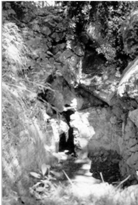
Αφτουλά, η πηγή

* Αν και τα στοιχεία δεν είναι πολλές φορές ακριβή, τα παραθέτομε ως έχουν για να μην αλλοιωθεί το κείμενο.