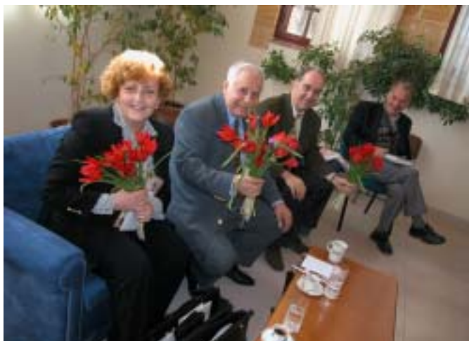
Στο Δημαρχείο Καμποχώρων τα κορίτσια πρόσφεραν στους καλεσμένους μας λαλάδες (χιώτικες τουλίπες)

Οι εκλεκτοί προσκεκλημένοι έμειναν στη Χίο από Παρασκευή βράδυ μέχρι Τρίτη απόγευμα. Στο