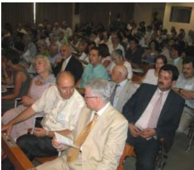
Από την έναρξη των εργασιών της Ομηρικής Ακαδημίας 2002, στο Ομήρειο Πνευματικό Κέντρο Δήμου Χίου