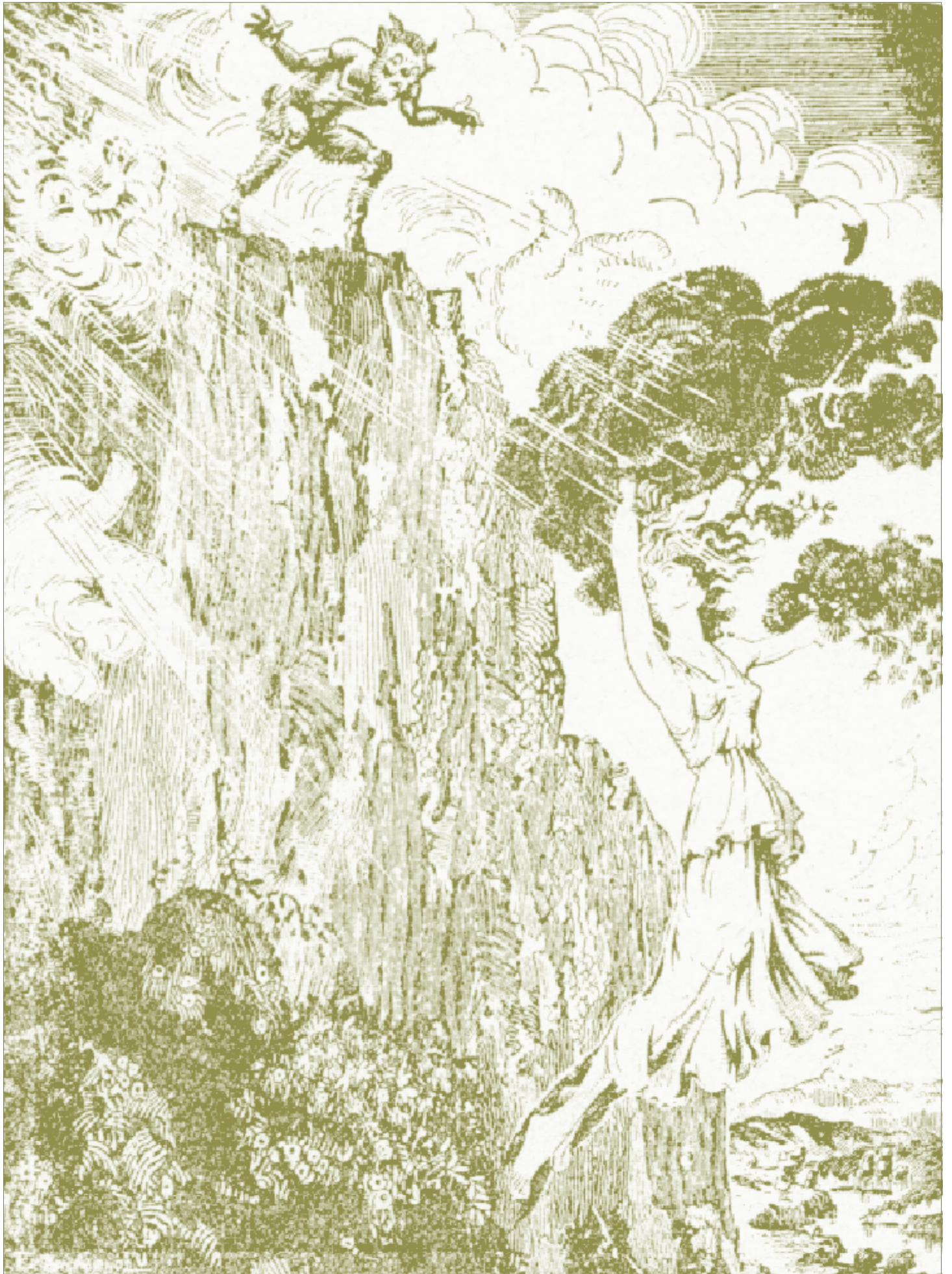
Πίτυς και Παν Ο μύθος στην σελίδα 25