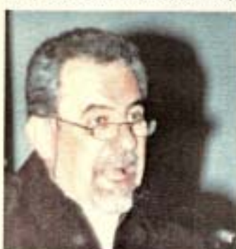
Ο ηθοποιός Μπάμπης Σαχτούρης

Είμαστε όλοι εμείς που παρά τις διαφορετικές απόψεις και ενίοτε τις διαφωνίες μας, καταφέρνουμε να συνυπάρχουμε και να δουλεύουμε όλοι μαζί για το καλό. Στηρίζοντας και υπηρετώντας τον Πολιτισμό που πιστεύουμε πως είναι το μόνο εργαλείο για να χτίσουμε ένα κόσμο καλύτερο.