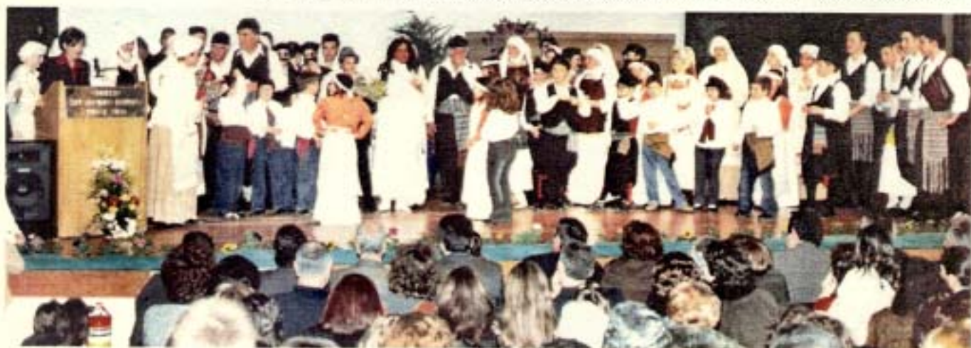
Ο «γάμος» έχει τελειώσει, ο κόσμος όρθιος χειροκροτεί και κορίτσια μοιράζουν από ένα τριαντάφυλλο στους χορευτές