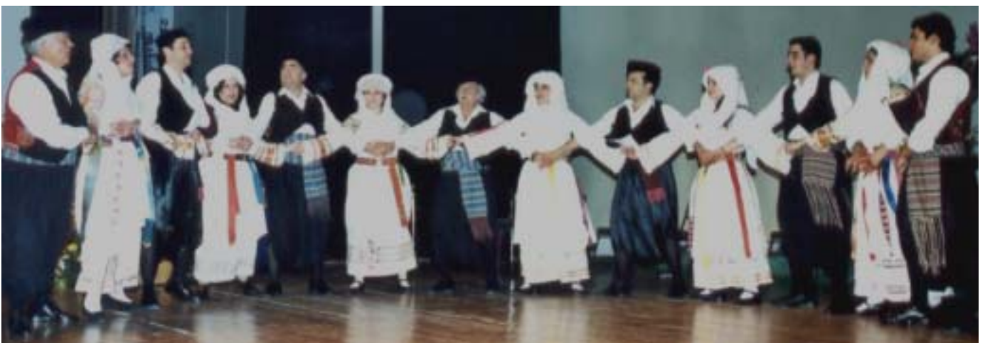
Το χορευτικό της Καλαμωτής χορεύει τον τοπικό χορό «κωλοσυρτό»