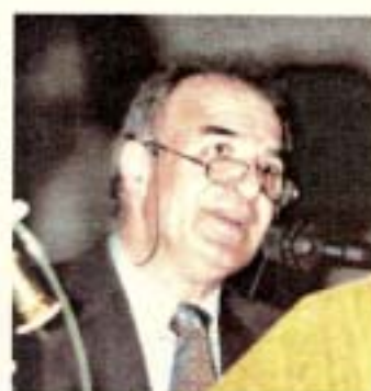
Ο ηθοποιός Δημήτρης Αυγουστήδης

Και τον παρουσίασαν με τον καλύτερο τρόπο. Ήταν το κάτι άλλο. Η νύφη (Κώστας Μενής) με τους κουμπάρους και τη συνοδεία μπήκαν στην αίθουσα και περνώντας τους διαδρόμους αστειευόταν με τον κόσμο, ενώ ο γαμπρός (Ευτυχία Νεαμονίτη) από τη σκηνή φώναζε μελιστάλαχτα: «Μαρικάκιμ έλα στην αγκαλιά μου... Όλοι συμμετείχαν στο δρώμενο που τελείωσε με τους δυο τελευταίους χορούς και το πρόγραμμα έκλεισε κάτω απ' τα θερμά χειρο-