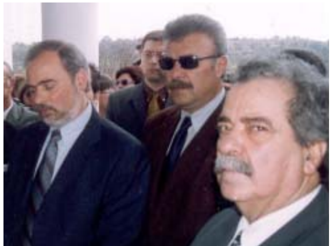
Οι Αρχοντες της Τοπικής Αυτοδιοίκησης μας τίμησαν

«Σεπτόν Ιερατείο, Αρχές του τόπου Πολιτικές και Στρατιωτικές, εκπρόσωποι της Τοπικής Αυτοδιοίκησης (με συγχωρείτε για τον τρόπο που αρχίζω αλλά κάποιον θα αδικήσω), Εκπρόσωποι Πολιτιστικών Σωματείων, άνθρωποι των Γραμμάτων και των Τεχνών, κυρίες και κύριοι. Η συγκίνηση δεν μου επιτρέπει να σκεφτώ και να μιλήσω σωστά. Το Περιοδικό «Δάφνη» και στο βουνό να πάει, ο κόσμος το ακολουθεί. Συγχωρήστε με, δεν είναι αλαζονεία. Είναι χαρά, είναι ευχαρίστηση, είναι ικανοποίηση, ότι οι επιλογές μας στηρίζονται από τον χιώτικο λαό. Μας τιμάτε πάντοτε με