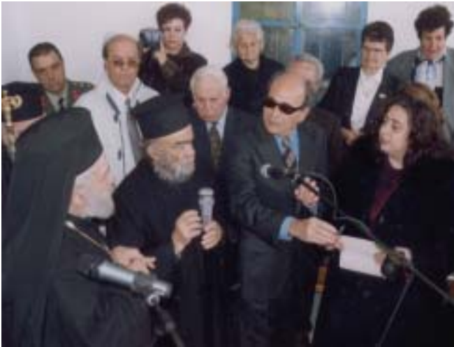
Ο Σεβασμιότατος τέλεσε το Τρισάγιο