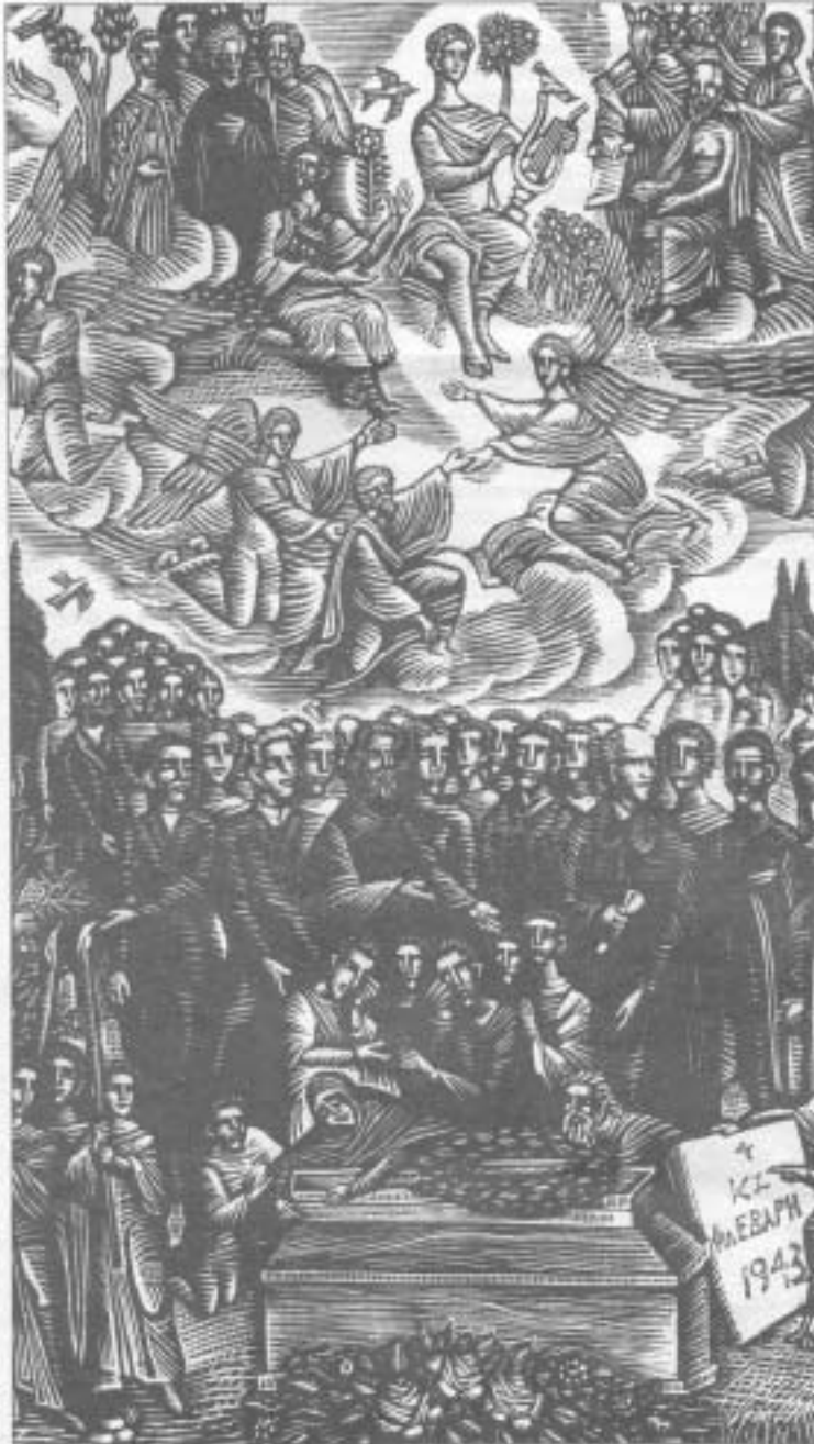
«Η ταφή του Παλαμά» έργο του Σπύρου Βασιλείου από την εφημερίδα «Καποδιστριακό»

Αρχαίο Πνεύμ' αθάνατο, αγνέ πατέρα του ωραίου, του μεγάλου και τ' αληθινού κατέβα, φανέρωσε κι άστραψε εδώ πέρα στη δόξα της δικής σου γης και τ' ουρανού.