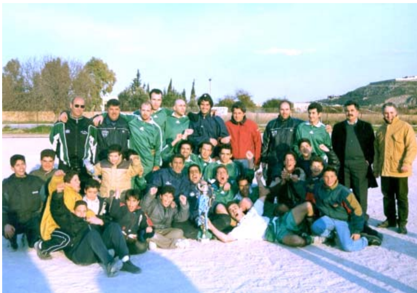
Ο Δήμαρχος Καμποχώρων, ο Πρόεδρος, ο Προπονητής και οι Παίκτες της Κυπελλούχου ΔΑΦΝΗΣ 2002-2003