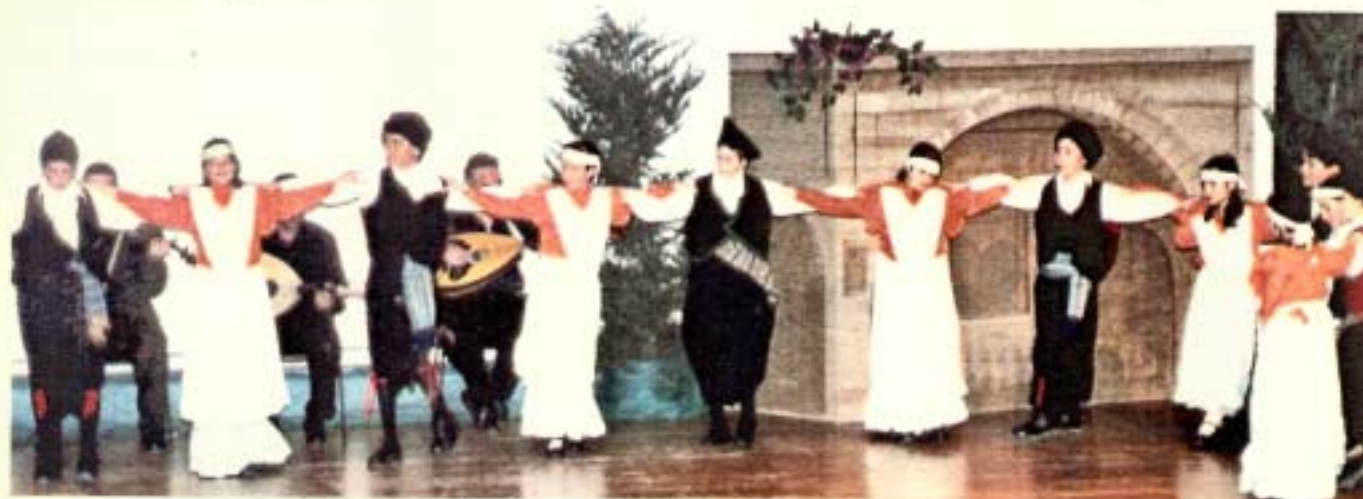
Συγκίνηση και μοναδικές στιγμές αξέχαστες

οι επαγγελματίες μας. Δεν είναι οι εργάτες, οι αγρότες, οι μητέρες, οι νοικοκυρές μας. Ούτε μόνο οι εκτός Χίου και Ελλάδας χωριανοί μας που με τους Συλλόγους τους της Αττικής, της Αμερικής και της Νεολαίας Αμερικής, προσπαθούν να κάνουν από ένα μικρό Δαφνόνα στον τόπο που η μοίρα τους έταξε να ζουν. Δεν είναι μόνο ο Ματθαίος Μυρώνης που εξελέγη τον περασμένο Νοέμβριο για δεύτερη φορά βουλευτής στην Πολιτεία της Νέας Υόρκης. Δεν είναι μόνο τα παιδιά μας που όλοι απόψε καμαρώνουμε. Δαφνόνας, είναι όλα αυτά μαζί!