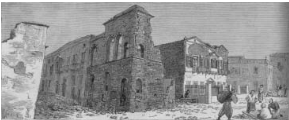
Η οδός Εγκρεμού μετά το σεισμό ' από το Περιοδικό Graphic, Βιβλιοθήκη Κοραή (με υπόδειξη Δημήτρη Μελαχροινούδη)

Αναφερόμενος στη βοήθεια του πληρώματος του Γαλλικού πλοίου Μπουβέ (προς τιμήν του καλεσμένου μας Νομπέλ Αρμάν), μεταξύ άλλων είπε: «...Λίγες ώρες αργότερα, καταφθάνει το Γαλλικό πολεμικό Μπουβέ, του οποίου η βοήθεια εγκωμιάστηκε...» και συνέχισε παρακάτω: «Όσον αφορά το Μπουβέ το πολεμικό πλοίο που με 40 άτομα πλήρωμα βοηθούσε την κατάσταση υπάρχουν οι εξής αναφορές: Καθ' οδόν βλέπομεν 2 Γάλλους αξιωματικούς παρακολουθούμενους υπό ναυτών φερόντων επί φορείου σώμα κόρης ψυχορραγούσης. Της ευκαιρίας ταύτης επελή-