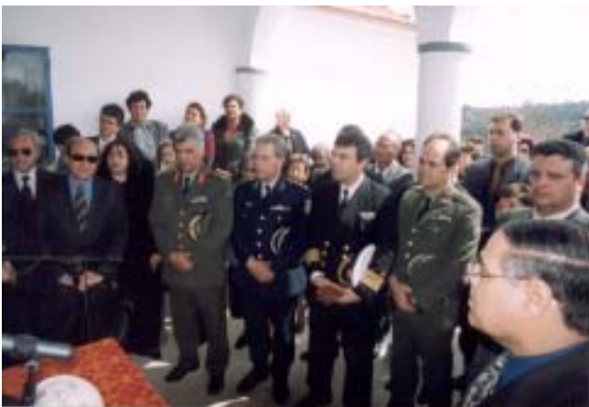
Οι Αρχές του τόπου ήταν εκεί

Εκεί θα κατασκευαστεί ένας αθλητικός χώρος, θα γίνει ανάπλαση όλου του χώρου εκείνου, θα συνδεθεί απόλυτα και αρμονικά με τον ιερό χώρο της Μονής του Ρουχουνιού και εφ' όσον το κατορθώσουμε να αναδείξουμε σταδιακά και τούτο τον χώρο, νομίζω ότι θα έχουμε αναδείξει μια μαγευτική και πολύ χρήσιμη διαδρομή και για μας και