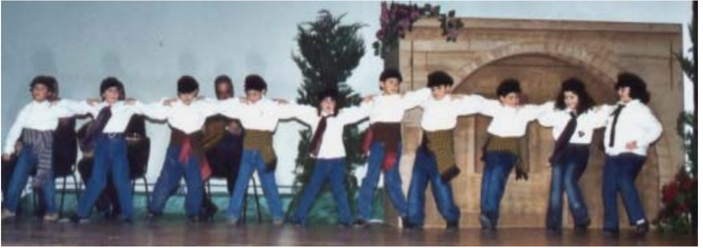
Τα «πρωτάκια» του χορευτικού μας, έκαναν... καλή δουλειά