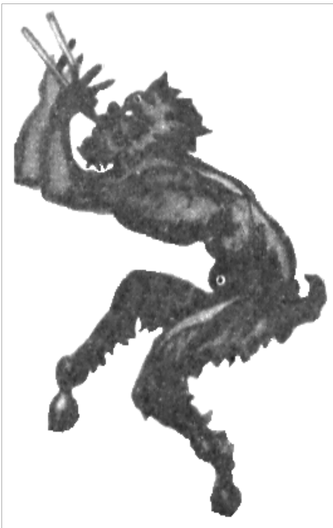
Ο θεός Παν

Όταν όμως φυσά βοριάς, το πεύκο βογκά, θέλει να του ξεφύγει, τα κλαριά του αγωνίζονται όπως άλλοτε τα χέρια της νύμφης, για να γλιτώσει από την αγκαλιά του και λες και φωνάζει ακόμα τον Πάνα να την σώσει από την καταστρεφτική αγάπη του Βορέα, του μεγάλου του εχθρού.