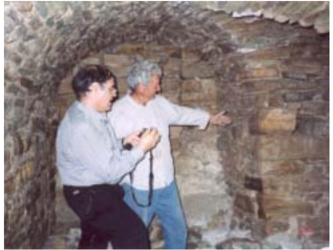
Στα... άδυτα του Παλιού Καταρράκτη

Ο Σεβασμιότατος Μητροπολίτης μας κ. κ. Διονύσιος παρά το φορτωμένο του πρόγραμμα,