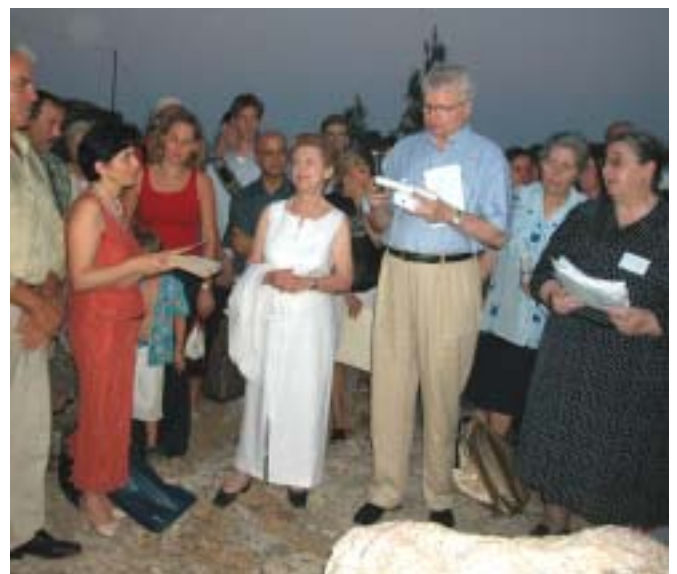
Πάνω στην Πέτρα-Σχολείο του Ομήρου, διακεκριμένοι ελληνιστές ανακηρύσσονται Επίτιμοι Δημότες Ομηρούπολης.